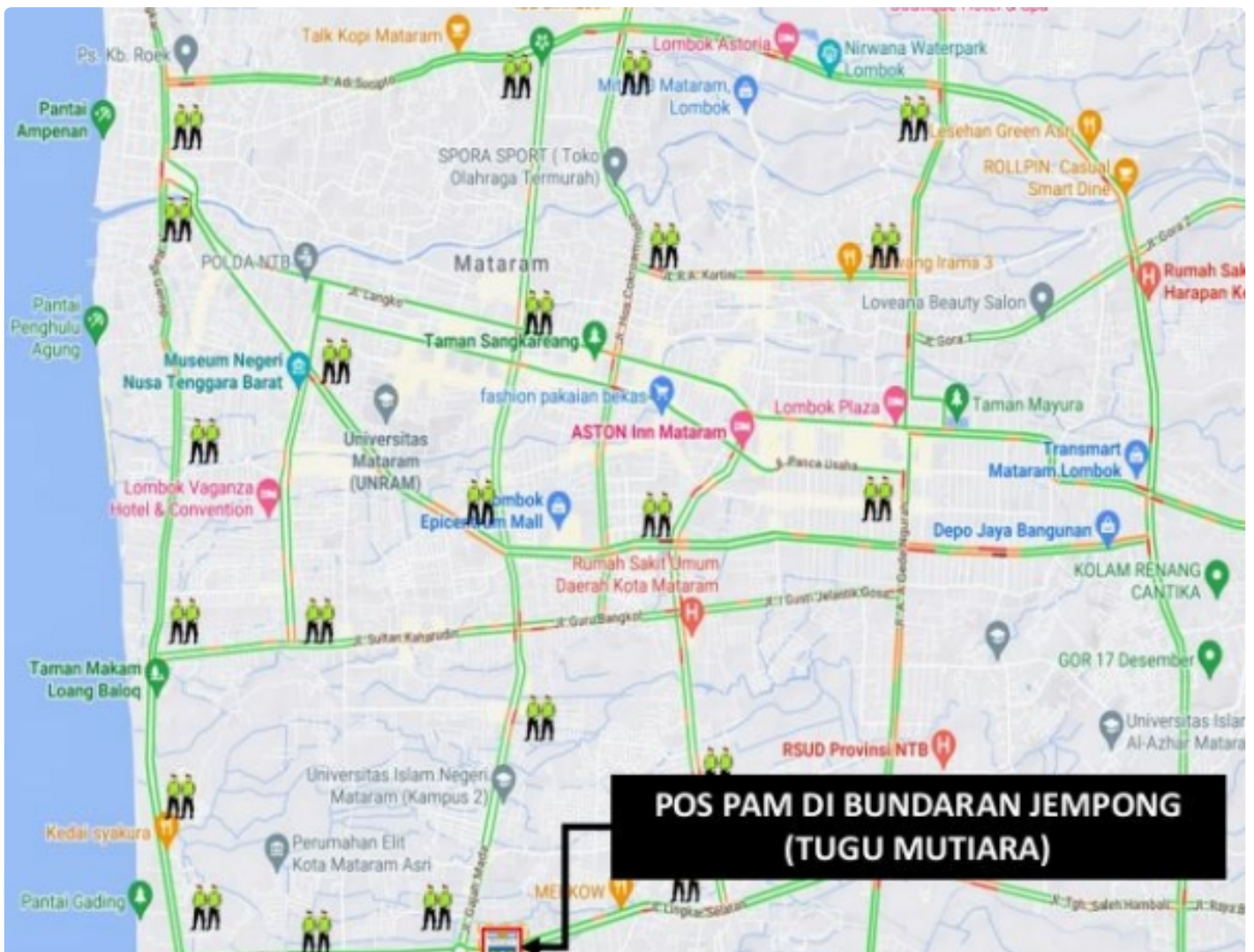
Personel yang Disiagakan pada Pos Pengamanan dan Pos Penyekatan, (04/11)

Mataram NTB - Mendukung terselenggaranya event Internasional Word Superbike (WSBK) Mandalika 2022 berlangsung sukses, ribuan personel akan disiagakan di dalam wilayah pulau Lombok, untuk itu para penonton tidak perlu